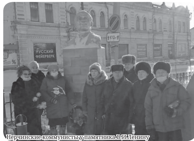
Нерчинские коммунисты у памятника В.И. Ленину

Буржуазный режим боится актуализации в современной политике