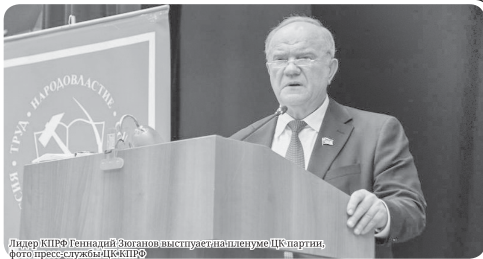
Лидер КПРФ Геннадий Зюганов выступает на пленуме ЦК партии

В отличие от «кремлёвских ботов» и либералов КПРФ формирует содержа-