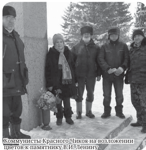
Коммунисты Красногочикоя на возложении цветов к памятнику В.И. Ленину

После выступления первого секретаря крайкома присутствующие возложили цветы к подножию памятника.