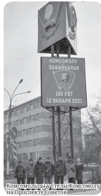
Комсомольцы у стелы Комсомолу на Проспекте Советов

– Наши ветераны Всесоюзного Ленинского Коммунистического Союза