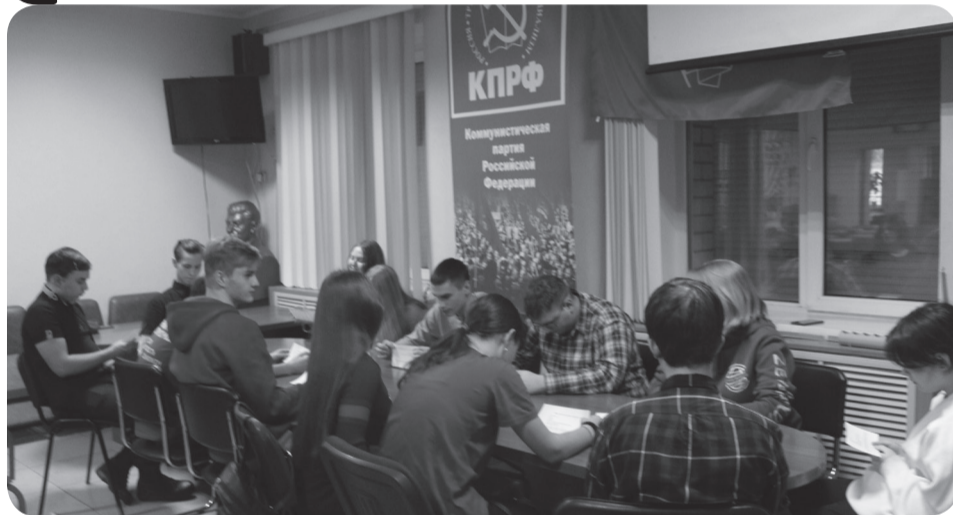
Дорогие наши читатели!

Комсомольцы Читы начали подготовку к предстоящему вековому юбилею Ленинской пионерии. Утверждён план мероприятий. Определены задачи и направления.