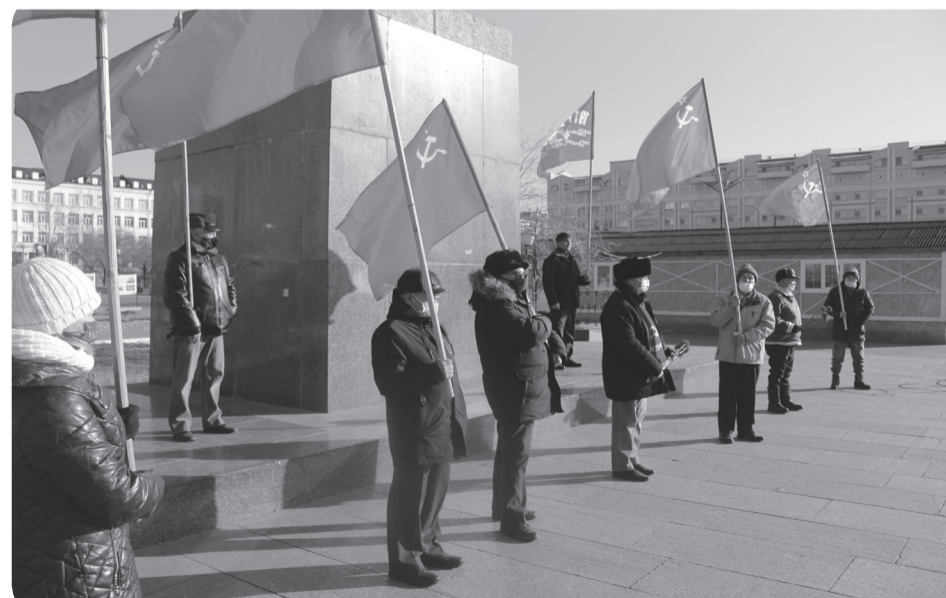
Пресс-служба Забайкальского краевого комитета КПРФ